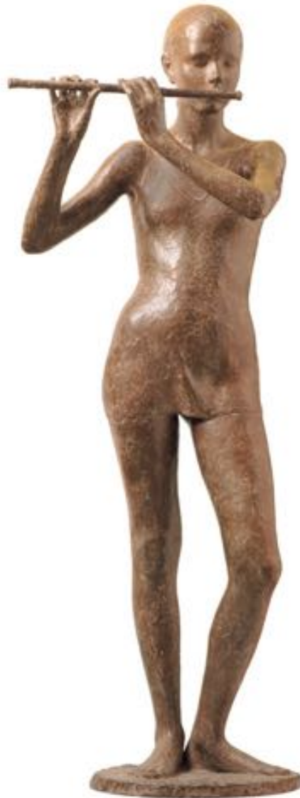
Adolescente con flauto - 1991, bronzo altezza cm 150

"Oltre il Canova" edizioni Mondadori a cura di Paolo Levi.