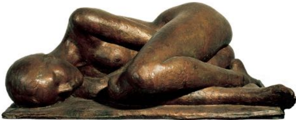
Nudo dormiente - 1999, bronzo cm 34x90x50

La Galleria Losano Associazione Arte e Cultura di Pinerolo, dopo la pausa estiva riprende l'attività espositiva con una mostra dello scultore Sergio Ùnia, in cui verranno presentate una ventina di importanti sculture in bronzo, terrecotte e una selezione di disegni.