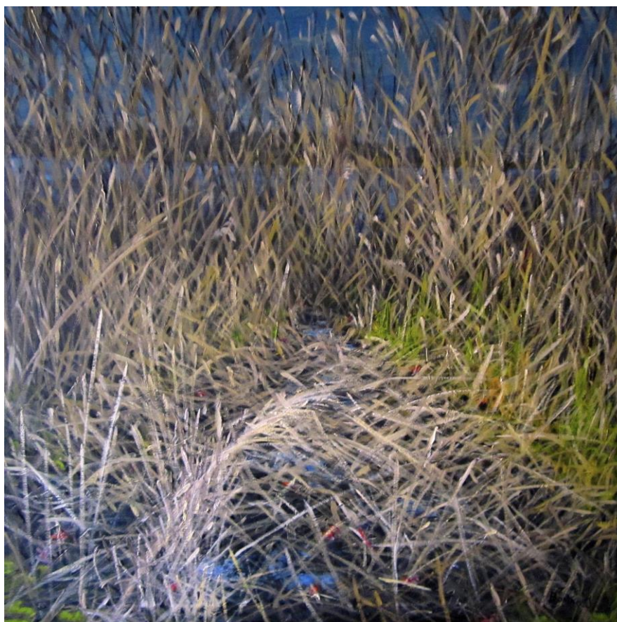
Lago Piccolo – Avigliana, Olio su tela cm. 90x90

Si inaugura sabato 29 novembre 2014 presso la Galleria Losano Associazione Arte e Cultura di Pinerolo, la mostra “L'anima e il corpo del paesaggio” , una personale del pittore Ivo Bonino dove verranno esposte una selezione di lavori a tema dell'ultimo periodo artistico.