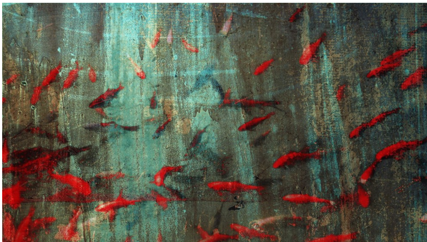
Visioni Fluide 5, 2011 – Modern print cm. 55 x 31